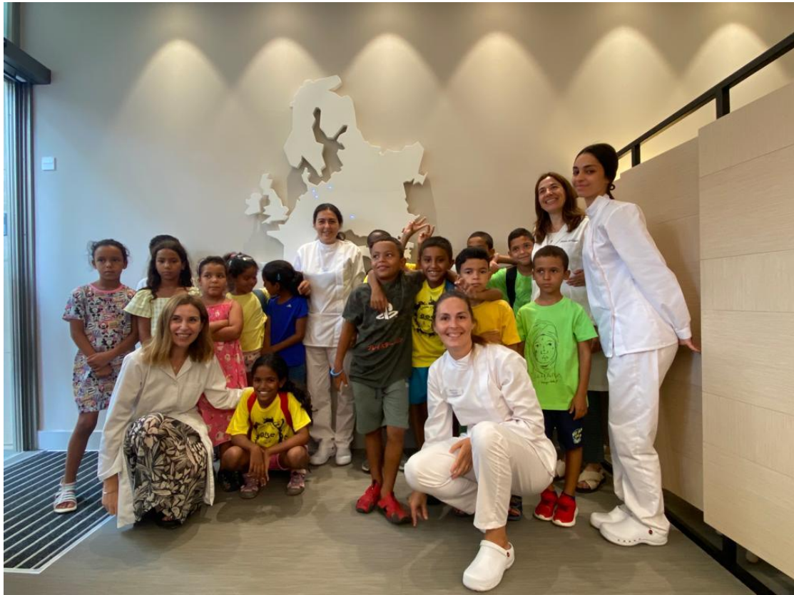
Revisió oftalmològica a la Clínica Baviera de L'Hospitalet de Llobregat