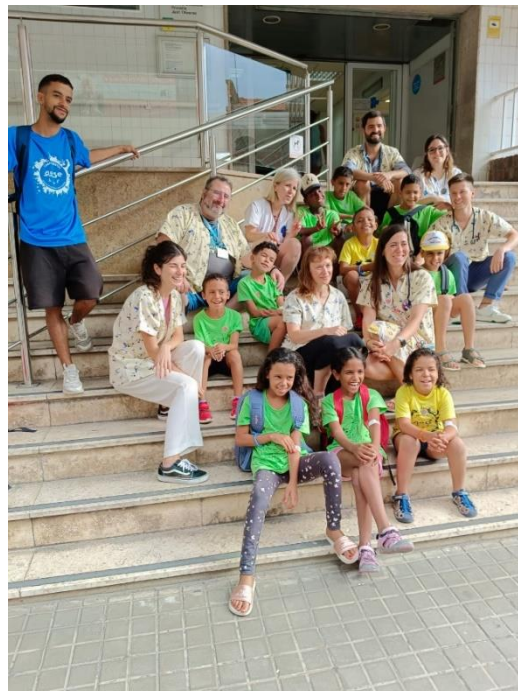
Dia d'analítiques al CAP de Just Oliveres