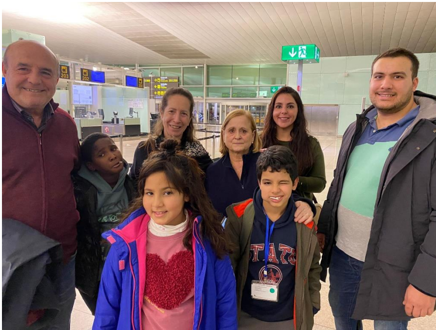
Tornada als campaments de dos dels nostres infants sahrauís al mes de desembre