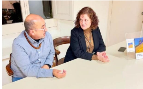
Presentació del llibre "El espejo de los ausentes" a Can Sumarro