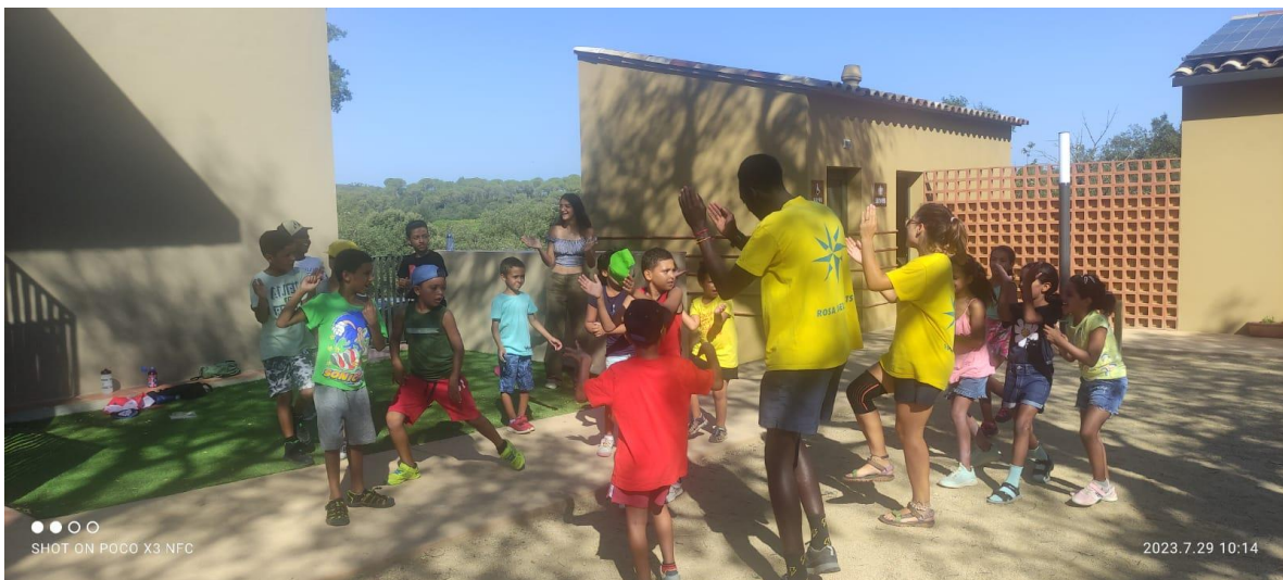
Colònies al Pou del Glaç, a La Bisbal de l'Empordà