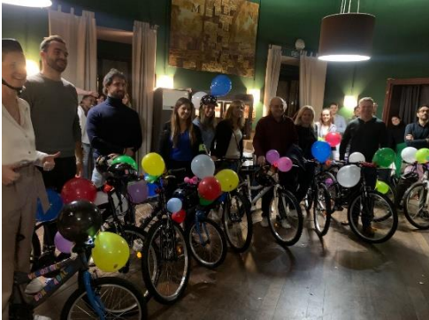
Recollida de la donació de bicicletes a Can Cortada