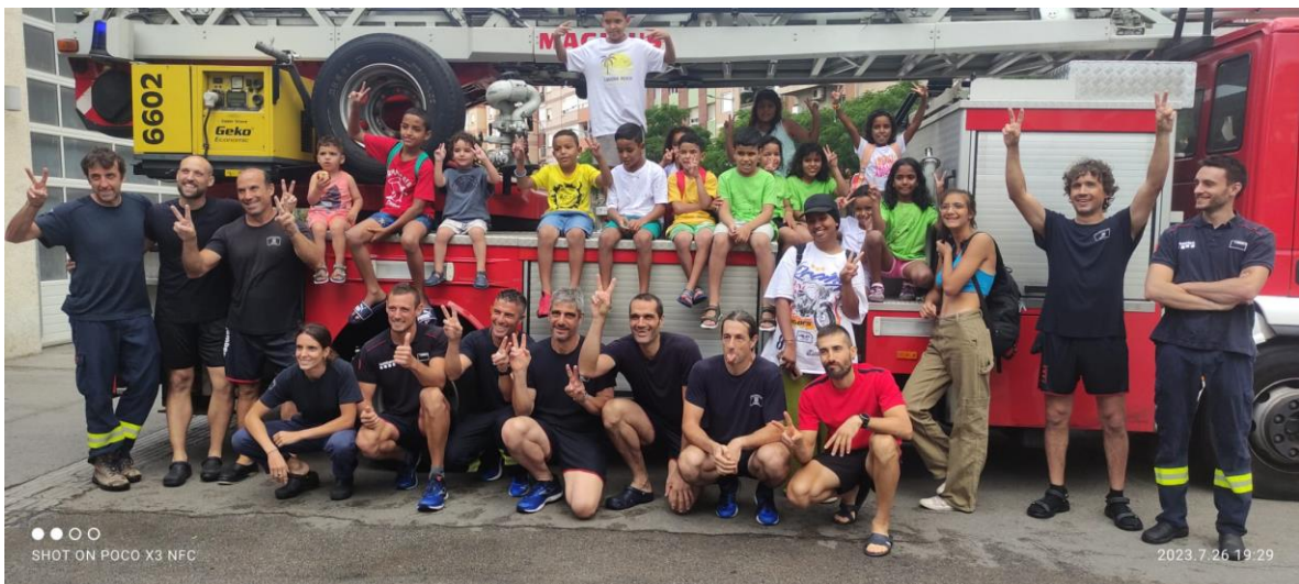
Una tarda de diversió amb els bombers de la nostra ciutat, l'Hospitalet de Llobregat