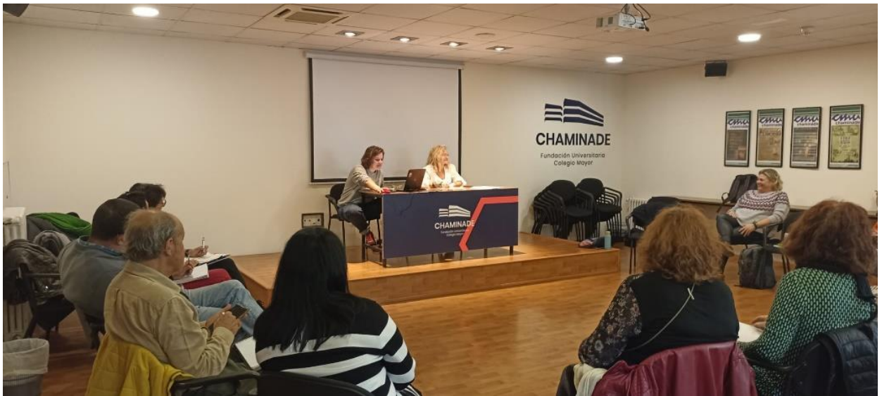
Reunió de la Coordinadora de Discapacitats a Madrid