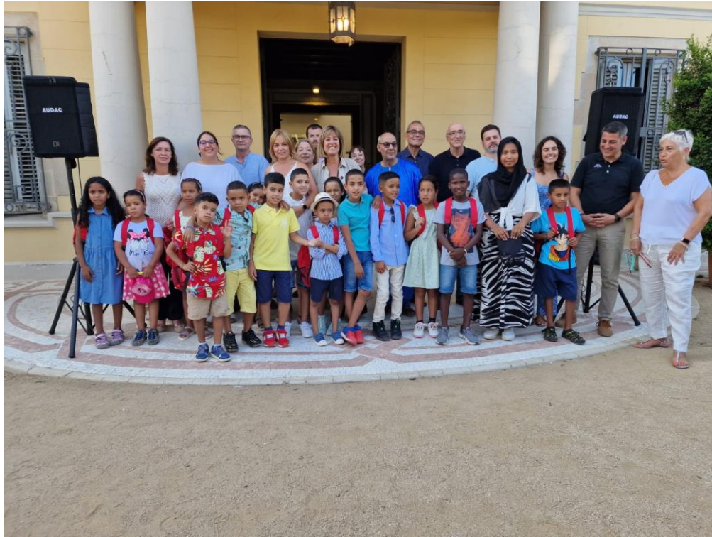
Recepció de l'alcaldessa al Palauet Can Buxeres