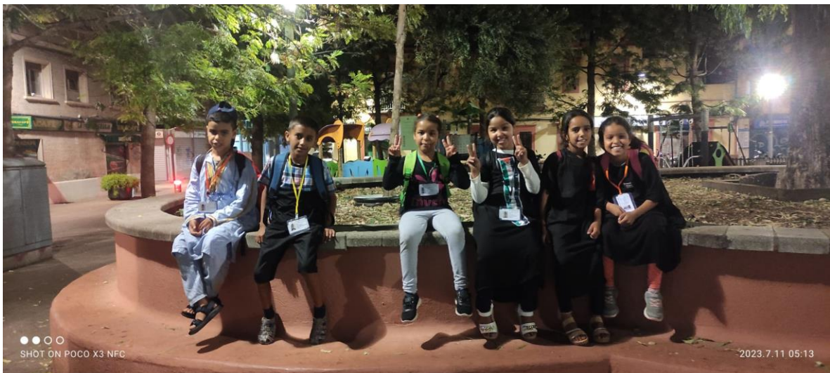
Arribada dels nostres nens i nenes sahrauís a la nostra ciutat