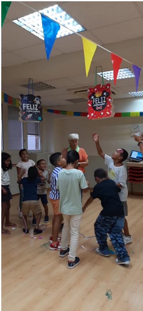
Festa de comiat