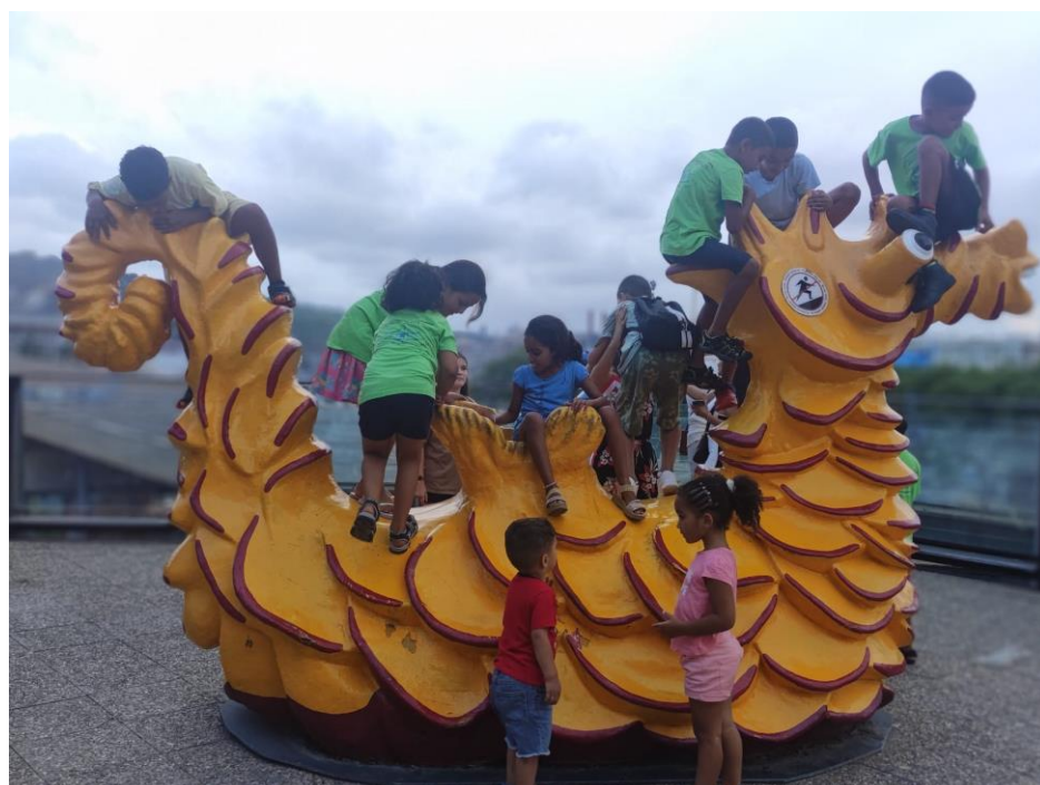
Una tarda a l'Aquàrium