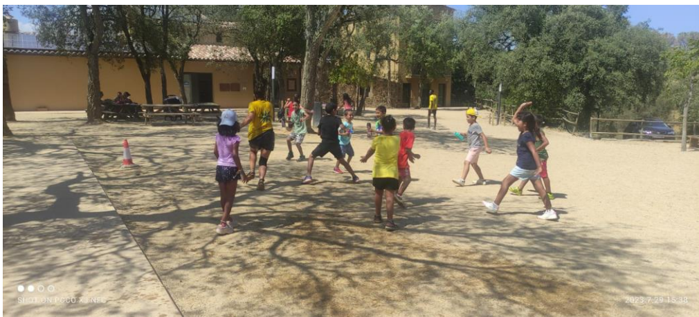
Colònies al Pou del Glaç, a La Bisbal de l'Empordà