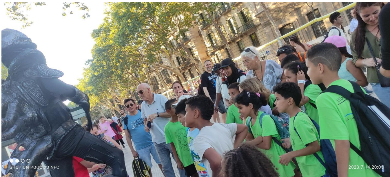
Una passejada per les Rambles de Barcelona