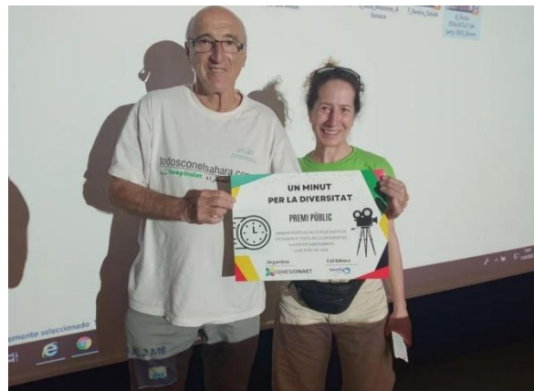
L'Hospitalet amb el Sàhara a la XXXIII Festa de la Diversitat