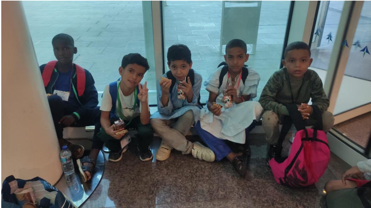
Arribada dels nostres nens sahrauís a l'aeroport del Prat