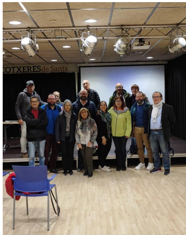
Reunió de la Coordinadora de VeP a les cotxeres de Sants